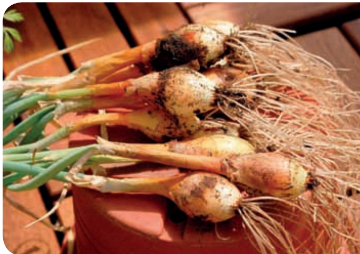
Cibuľka vypestovaná zo sadičky v kvetináči na balkóne.

Ak si kúpite v záhradných potrebách vrečko sádzačky cibulky, už máte polovicu práce vyriešenú. Tá druhá spočíva v zaobstaraní vhodnej nádoby, ktorá by nemala byť veľmi plytká, môžete použiť napríklad poriadne vyumývané tetrapakové škatule od mlieka, na ich dno nasypete drenážnu vrstvu štrku, na ňu položte papierový kávový filter a ten zasypete zemou. Jemne utlačte a polejte. Do vlhkej zeme zatlačte sadičky v rozumných, asi 3 cm vzdialenostiach, a položte ich na slnečné miesto. Zo zelených stoniek môžete odstrihávať priebežne, podľa potreby, a tak si zabezpečiť pravidelný prísun vždy čerstvej cibuľkovej vňate.