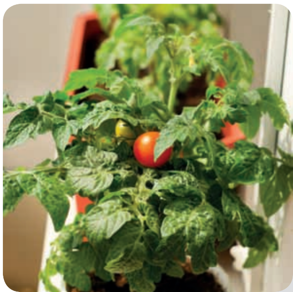
Rajčiny v nádobe na okennom parapete.

Na každom trhu sa nájde aspoň jeden stánok, v ktorom kúpite sadeničky rajčín. V balkónovej záhradke pekne ukážu nízke odrody kričkových cherry rajčín. Obyčajne majú veľa kvetov, čo znamená veľa plodov. Tým, že sú malé, rýchlo dozrievajú, a tak sa môže stať, že si pri priaznivom počasi budete pochutnávať na balkónových cherry rajčinách ešte aj v októbri.