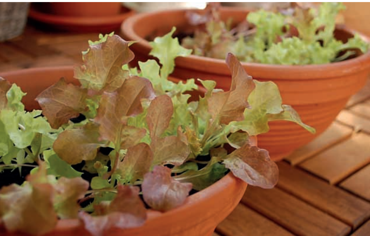
Šaláty určené na „česanie“ pestované zo semienka v balkónových nádobách.

Šaláty sa dajú pestovať v akejkoľvek nádobe priamo zo semienka. Zbierajú sa postupne, po listoch, čím sa zabezpečí kontinuálna úroda. Zčať s pestovaním môžete hneď skoro na jar – šalát patrí medzi mrazuvzdorné rastliny, napriek tomu je však dobré, aspoň spočiatku, chrániť ho pred zimou jednoduchým, doma zhotoveným, fóliovníkom skonštruovaným z palíc a igelitu.