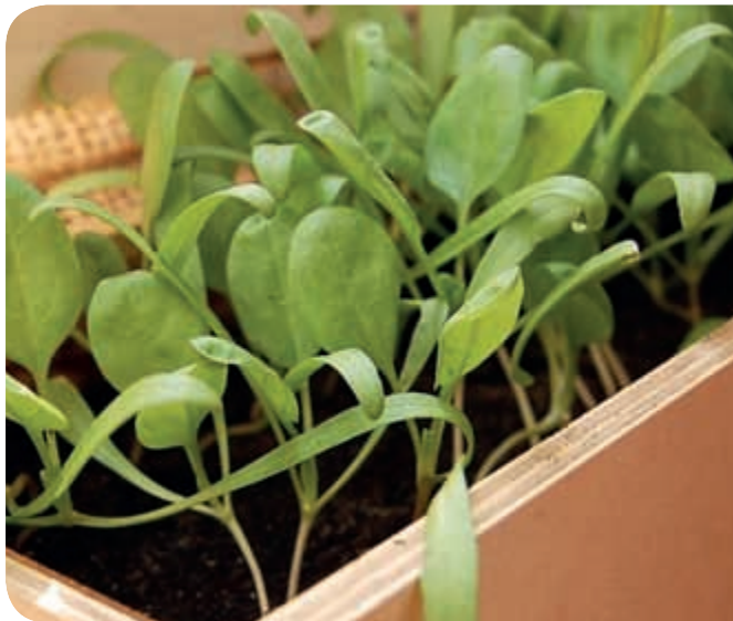
Mladý špenát pestovaný v debničke od vína vystlanej igelitovou fóliou

Nebojte sa vysiať do každej nádoby zo pár semienok – špenát rastie všade, rýchlo a stále – od jari až do zimy, s výnimkou najhorúcejších týždňov, keď má tendencie vybiehať do kvetu a horknúť. Ak vám zakvitne, usušte stonky a uložte si semienka. Keď horúčavy pominú, môžete si ich opäť vysadiť.